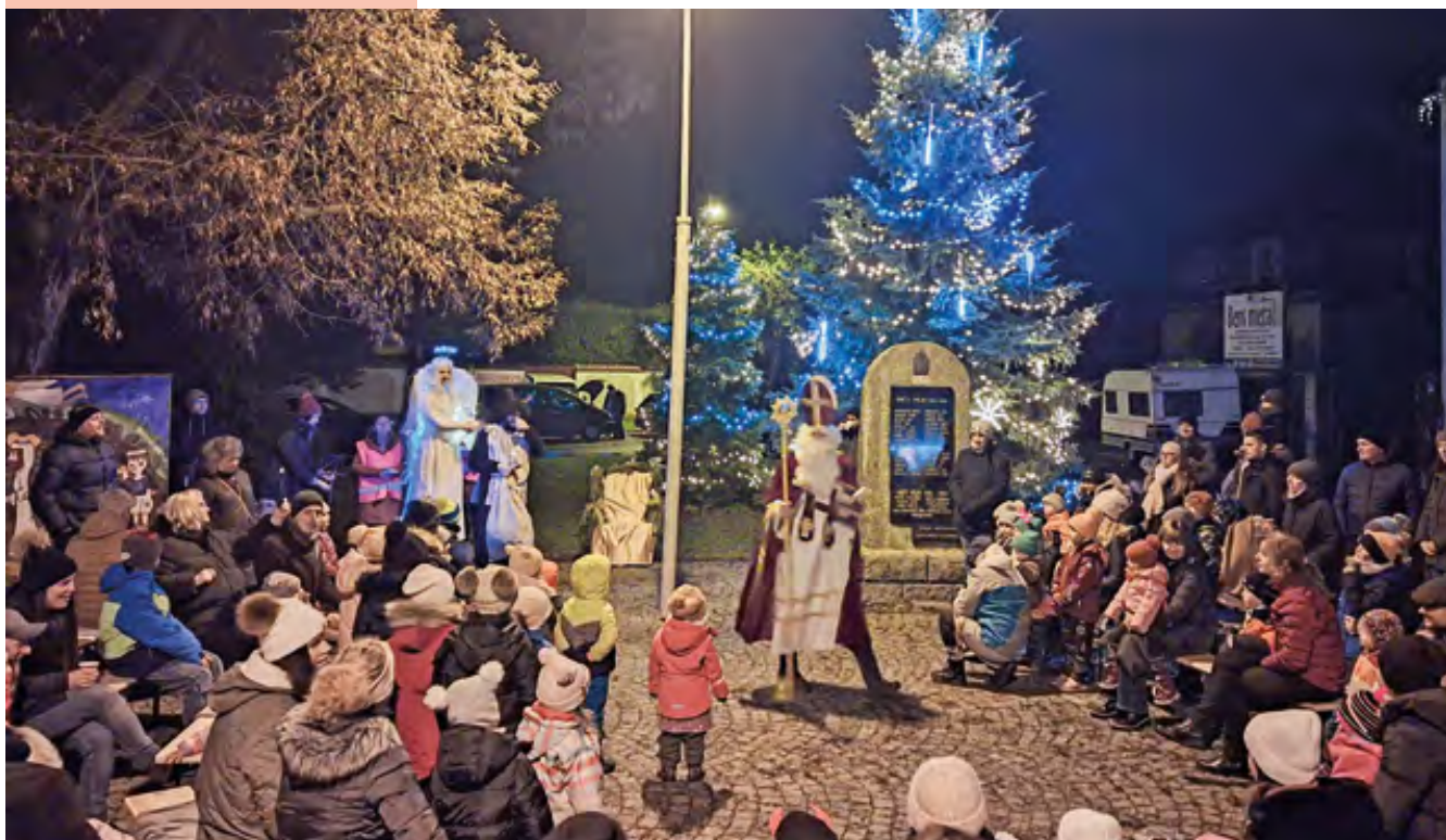
5. 12. 2025 – šestajovický Mikuláš