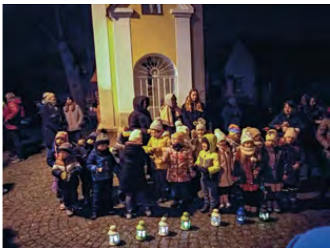
Koledy zazpívaly děti z MŠ Lodička

Děkujeme všem týmům za účast v soutěži, vítězi gratulujeme a těšíme se na pěkné předvánoční setkání zase další rok.