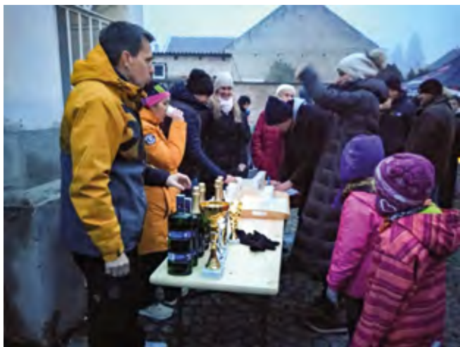
Punče hodnotila nezávislá porota z řad návštěvníků

třeba grilovaná klobása. Večer probíhal v příjemné atmosféře. V pět hodin přišel čas na rozsvícení vánočního stromu. Po jeho rozsvícení zazpívaly pásmo koled dětí z obecní mateřské školy. K nim se samozřejmě přidali i hosté akce.