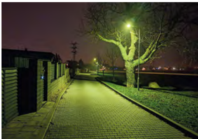
Lampy VO s fólií pro žluté světlo v ulici Nad Údolím

Bílá svítidla se stále v několika ulicích Šestajovic nacházejí. Obec bude postupně u těchto lamp problém modrého světla řešit . Jako neekonomičtější a k životnímu prostředí nejšetrnější se zatím ukazuje použít na původní svítla s bílým světlem barevnou fólii, která modré světlo odfiltruje. Technické služby obce již tyto