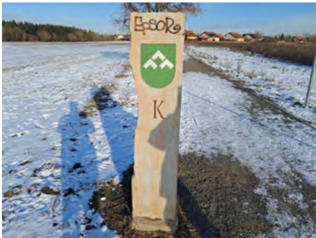
Hraniční sloup poškodil vandal graffiti

Žádáme občany, kteří mají jakékoliv informace k tomuto poškození hraničního sloupu nebo graffiti poznávají (může být pro autora typický), aby tyto informace poskytli Obecní polici Šestajovice na tel. 725 378 590. Děkujeme.