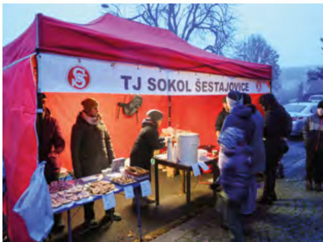
Jeden ze soutěžních týmů

třeba grilovaná klobása. Večer probíhal v příjemné atmosféře. V pět hodin přišel čas na rozsvícení vánočního stromu. Po jeho rozsvícení zazpívaly pásmo koled dětí z obecní mateřské školy. K nim se samozřejmě přidali i hosté akce.