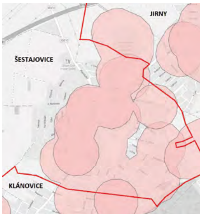
Zákon omezuje pyrotechniku skoro v celých Šestajovicích

Ministerstvo zemědělství vydalo mapu, která plochy s omezením používání pyrotechniky zobrazuje. Pokud se podíváme na tuto mapu, tak je vidět, že skoro celá zastavěná část Šestajovic je v červené barvě. Tedy že až na dvě místa je používání pyrotechniky v naší obci zákonem omezeno . Tyto dvě místa bez omezení se